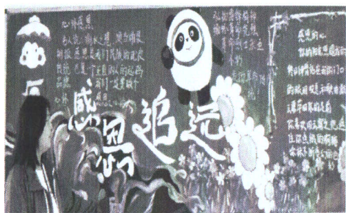
图 2-3 黑板报比评

学校重视学生的思想品德教育，每周三晚上为班会课，班主任根据学校总体工作安排及班内学生存在的问题召开不同形式的主题班会，对学生进行德育教育。重视主题升旗仪式，充分利用每周升旗仪式的“国旗下的讲话”，围绕“安全、卫生、文明守纪、学习，感恩”等方面，对同学们进行爱国主义、集体主义教育、感恩教育，培养和提高同学们的爱国热情和行为习惯的养成，并让优秀学生作国旗下发言，提高国旗下讲话的教育效果。“课前小故事，传递大能量”活动，每天班呼过后由一名同学为大家讲述一个励志小故事，通过这种形式，使同学们在潜移默化中受到熏陶，从“小故事”中收获“大道理”。并倡议学生们回家后感恩父母，为父母做些力所能及的事情，教育学生时时刻刻学会感恩。同时学校坚持开展各种主题教育活动，开展了主题班会、主题黑板报评比、学校广播站推广普通话宣传活动、“树立语言规范意识，提高民族文化素质”主题升旗仪式，进行以“弘扬高尚师德，潜心立德树人”为主题的升旗仪式，在全校营造人人尊师重教的良好氛围。在文化课上，按照教育部门要求开设了《职业生涯规划》《职业道德与法律》《哲学与人生》等规定的德育必修课；校园文化建设上，在校园走廊门厅进行文化布置，内容包括教师仪容仪表行为规范、中职生学生行为规范、医学生誓词、技能比赛等。如图 2-1