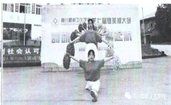
图 2-7 健美操比赛