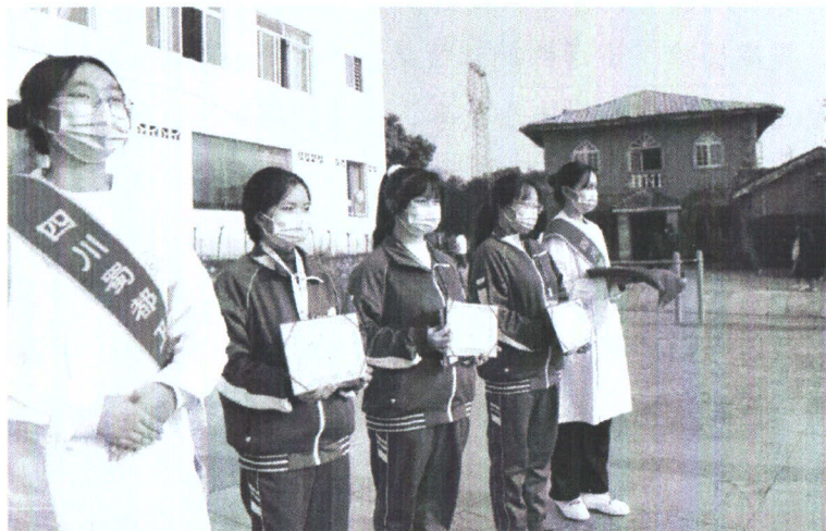
图 2-5 颁发国家奖学金

学校认真执行国家、省、市学生资助政策，扎实推进各类资助发放工作，确保符合条件的学生享受免学费和国家助学金，2021—2022 学年享受免学费金额为 190.66 万元；享受国家助学金金额为 54.1 万元；享受成都市民生工程免住宿费金额为 19.18 万元，享受国家奖学金 3 人，金额 1.8 万元。目前，所有资助金已全部拨付和发放到位。