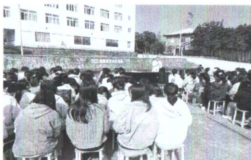
图 2-4 国旗下讲话