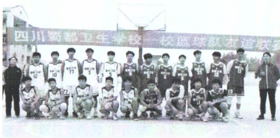
图 2-6 校篮球友谊联赛

学校重视学生学习能力、岗位适应能力、岗位迁移能力、创新创业能力的培养。学校按照规定和要求，每学年组织举行“健美操比赛”“礼仪比赛”“广播体操比赛”“啦啦操比赛”“篮球比赛”，学校安排专任老师组建学生合唱团、舞蹈团、礼仪模特团，所有活动和学生生活活动团均做到有方案、有安排、有过程中性资料，丰富了学生的艺术生活，同时提高学校艺术教育质量。为提高学生的专业技能水平，强化专业课教学管理，学校制定了各专业学科比赛制度，将比赛纳入学校教育教学常规管理之中。通过一系列比赛活动，既提高了学生的学习兴趣，又选拔出了一批优秀的参赛选手，使我校教学质量迈向新水平。