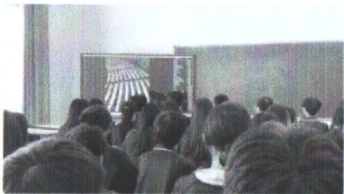
图 2-1 学生共同学习总书记讲话