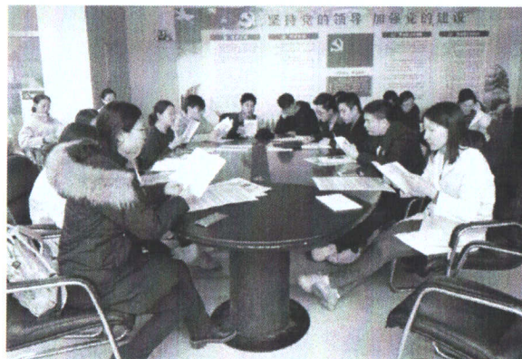
图 2-2 教职工学习党史